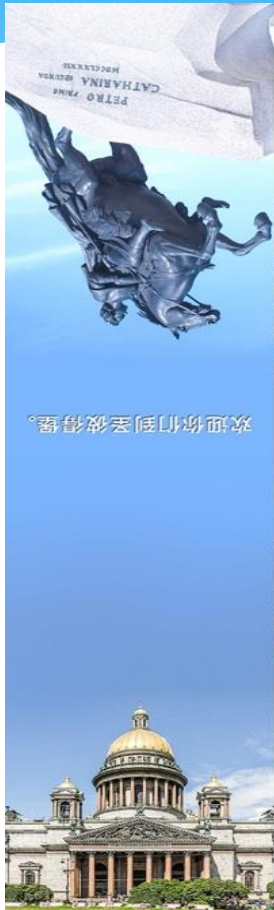
圣彼得堡的著名景点